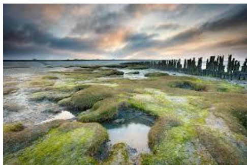
Het wad bij Moddergat

In 2019 deden we mee aan nationale en provinciale initiatieven zoals in het voorjaar “Help pake en beppe de vakantie door”, het Nationaal Museumweekend (april); de Kindermaand (oktober), de Nacht van de Nacht (oktober) en de provinciale verhalenavond (november). Daarnaast organiseerde het museum twee eigen activiteiten, de Fiskrinsterkuier (september) en de Simmermerk (augustus). Ook was het museum podium voor de Musical De Zeevrouw (augustus) en de netwerkvond van de Stichting Verdronken Geschiedenis en de Stichting Maritieme Archeologie (november). Daarnaast organiseerden we kinderactiviteiten in voorjaars- en herfstvakanties.