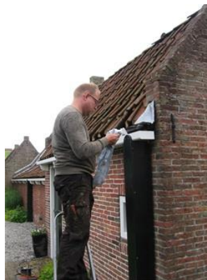
Restauratie en verven dakgoten

In overleg met de gemeente Noardeast-Fryslân is ook in 2019 gekeken naar onderhoudskwesties van de drie vissershuisjes die wij van de gemeente huren. Het betreft hier zaken als onderhoudswerk, restauratie en groenvoorziening. In de aanpak lopen ook de vissershuisjes en bijgebouwen in eigendom van de St Musea Noardeast Fryslân mee. Zo zijn in 2019 alle sloten vervangen in verband met veiligheidseisen en is er schilderwerk gedaan aan de buitenzijde van de huisjes. Ook zijn er houten dakgoten vervangen.