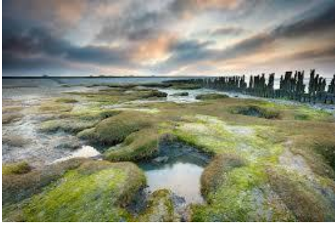
Het wad bij Moddergat

Samen met wadloopgids Patricia Tenthof organiseerde het museum in 2020 wadloopactiviteiten. Er was keuze uit diverse arrangementen zoals 'Verhalen achterna', de expeditie naar de Peazemerrede (vanaf 14 jaar) en de 'Schepnetjestocht', een ontdekkings-tocht naar de pier van Moddergat (vanaf 8 jaar).